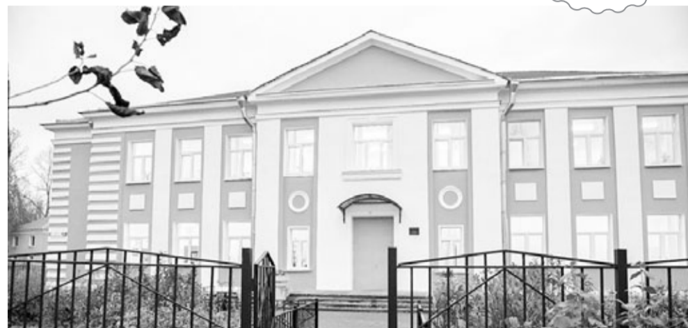
Здание музыкального отделения ДШИ