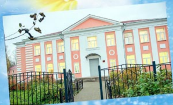
К золотому юбилею Отрадненской детской школы искусств